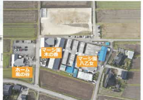
敷地造成工事完成