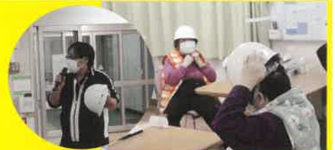
八乙女ヘルメット着用訓練

令和6年1月1日、石川県で最大震度7の能登半島地震が起きました。ここマーシ園でも大きな揺れにより、空調や照明のカバーの落下、天井の石膏ボードにひびが入るなど影響がありましたが、幸い利用者・職員にケガもなく生活に影響を及ぼすことはありませんでした。毎年行っているシェイクアウト訓練のかがあって、「すぐに頭を覆うことができた」と話されている利用者さんもありました。今年度は、土砂災害想定訓練（9/29）、消防マニュアル訓練（10/11）を実施しましたが、これからも不測の事態に迅速に対応できるよう、利用者・職員一同気を引き締めて訓練に取り組んでいます。